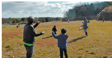
▲一般墓地 ◀手作り凧あげ教室

能です。申請手続きは令和6年3月7日(木)まで、みどりが丘公園事務所にて随時受け付けています。申し込み手続き等の詳細は、みどりが丘公園のホームページをご覧ください。どうか、当園事務所や区役所等に置いてあります「令和5年度一般墓地(普通墓地・芝生墓地) 使用者募集案内」をご確認ください。